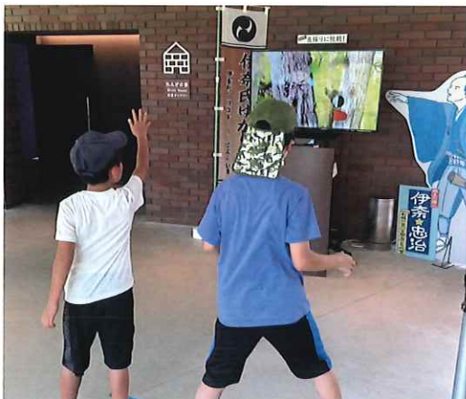
夏休み イイナパーク