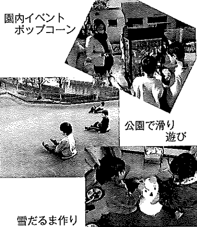
園内イベント ポップコーン