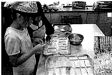
アップルパイ作り

生を送るために欠かせないものだと思います。私たち大人は子どもたちに対してこれらのことを教えるだけではなく、自分自身も実践することが求められます。大人は子どもたちが手本です。子どもたちに対して愛情や信頼を示し、尊重し、サポートしてあげましょう。そして、子どもたちから学ぶこともあります。子どもたちは、私たちに新しい視点や発見や驚きを与えてくれます。私たちも、子どもたちと一緒に成長して行けたらと思います。