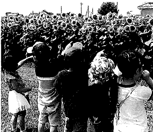
ひまわり畑の前で//

児童養護事業は行政との調整、養護児童への心配り、働く職員への全体的ケア、施設の改良や維持、後援会活動等々を続けていけば、何とか転がして行けるのかも知れません。しかし、それだけで良いでしょうか。この「イエスの栄光の証し」という立ち位置が無くては、養護事業は他の人々に任せても差し支えはないと思えます。ですから、「キリスト教主義」は常に立ち返る必要のある「原点」ではないでしょうか。