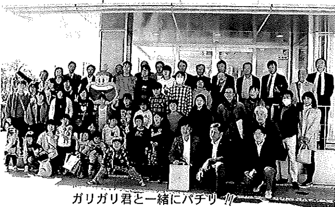
ガリガリ君と一緒にパチリ

☆浦和別所教会で花の日礼拝が行われました。花の日礼拝では、子どもたちを中心とした礼拝が行われ、礼拝後に消防署と警察署にお花を届けます。ホザナ園からは三名の子どもたちが参加しました。いつも教会に来てくれる子どもたちと一緒に花を届けに行きました。 (六月十六日)