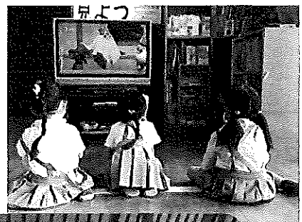
幼稚園バスを待つ園児