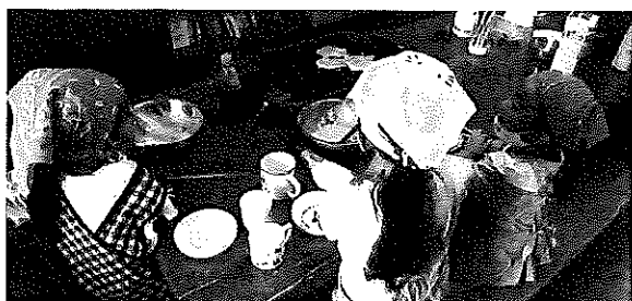
お楽しみイベント! 職員と子ども達の手作りメニュー