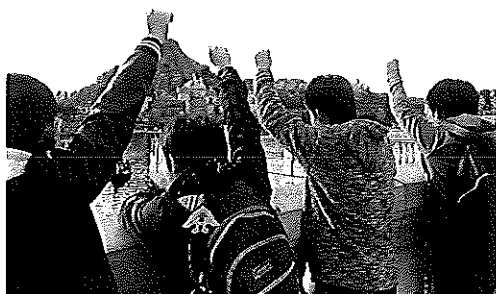
お楽しみ会「ディズニーシー」

私は2歳からホザナ園に来てこの3月に卒業して大学に行きます。大学では幼児教育を学びます。幼稚園教諭になったら子ども達はもちろん、子ども達だけではなく保護者からも信頼される先生になりたいです。保護者からの意見を真摯に受け止め、保護者の気持ちに寄り添える先生を目指します。保護者との信頼関係を築くことは子育て支援のサポートに繋がります。問題になっている虐待を防止することができると思っています。今までたくさんの人達から愛情をたくさんもらったので、私自身も愛情を与える大人になりたいです。