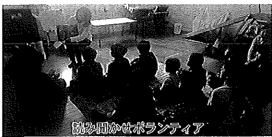
読者問答世ランディア

一人ひとりがどんな複雑化して いる今、ある時「何年勤めてもベ テランにはなれない!」どんな立場 に居ても偉くない!いつまでも新 人だと思わないとやっていけない ぞ!と思わないといけないんだ!」 と言われたことがあります。こ の言葉を聞いた時は先が見えず、 目の前が真っ暗になりましたが、 この言葉があったからこそ、ここ までこれたのかもしれない。今 の私はいろんな面でまだ未熟で す。いつの日か、この言葉を誰か に胸張って言いたいと思います。 5年目を迎える2020年度はそ の第1歩として、まだ確立できて いない「どんな職員になりたいの か?」「どんな人を目標にしたい のか?」を見つけ出したいと思っ ます。そして、《愛情》を持って、子どもたち一人ひとりと接し、日々の生活を振り返り、積み重ね、次に繋がっていくことを信じて、 これからも精進していきたく と思います。