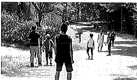
宇都宮冒険センター