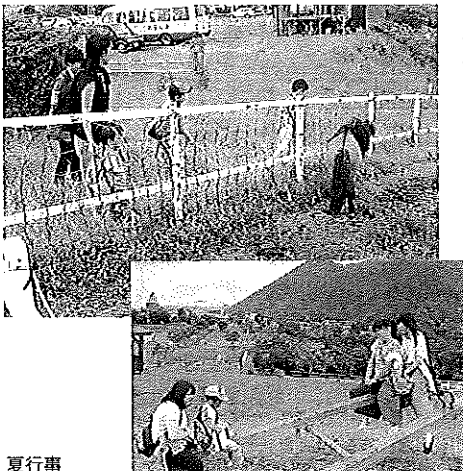
夏行事 動物ふれあいアスレチック

今年の夏、塾に行き初めて少しずつ理解できる問題が増えて来て、楽勝だなと思っただけ、北辰テストでは、いい結果がでず、その時初めて、自分がどれだけ勉強ができていないのかを知りました。大人にも「勉強しろ」ってよく言われるし、そういうのが最初の方、うるさくて嫌だったけど、よく考えてみたら、人生一度の高校受験なので楽しみたいです。